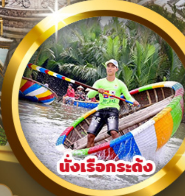
นั่งเรือกระดง