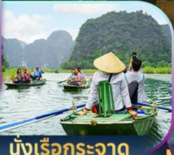
นั่งเรือกระจัด