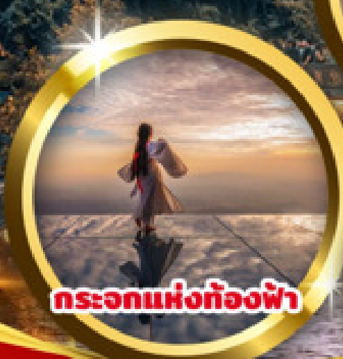
กระเอกแห่งท้องฟ้า