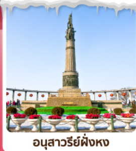
อนุสาวรีย์ผิงหง