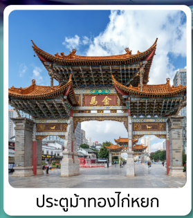
ประตูม้าทองไค่หยก