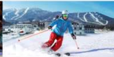
ลานสกียาปู้สี้

*ทางบริษัทฯ ขอสงวนสิทธิ์ในการสลับโปรแกรมทัวร์ตามความเหมาะสมขึ้นอยู่กับสถานการณ์หน้างาน โดยคำนึงถึงผลประโยชน์ของลูกค้าเป็นสำคัญ