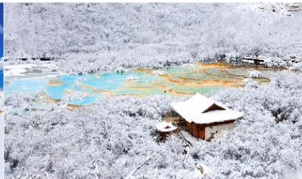
อุทยานแห่งชาติหวงหลง