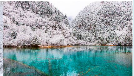
อุทยานแห่งชาติจิวจ้ายโกว

*ทางบริษัทฯ ขอสงวนสิทธิ์ในการสลับโปรแกรมทัวร์ตามความเหมาะสมขึ้นอยู่กับสถานการณ์หน้างาน โดยคำนึงถึงผลประโยชน์ของลูกค้าเป็นสำคัญ