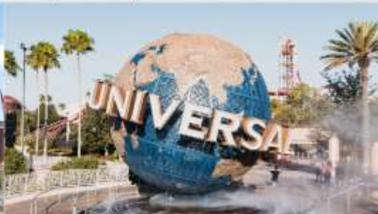
ยูนิเวอร์เซล ปักกิ่ง รีสอร์ท