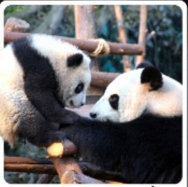
หุบเขาแพนด้าดูเจียงเอี้ยน