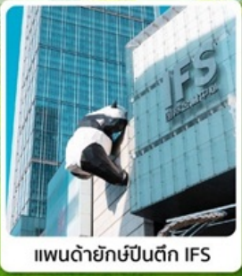
แพนด้ายักษ์ปีนตึก IFS