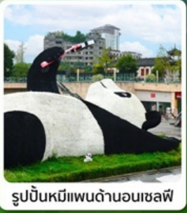
รูปปั้นหมีแพนด้าบนเซฟิ