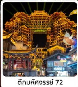
ตีทมหัศจรรย์ 72