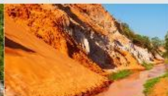
ลำธารนางฟ้า

*ทางบริษัทฯ ขอสงวนสิทธิ์ในการสลับโปรแกรมทัวร์ตามความเหมาะสมขึ้นอยู่กับสถานการณ์ปัจจุบัน โดยคำนึงถึงผลประโยชน์ของลูกค้าเป็นสำคัญ