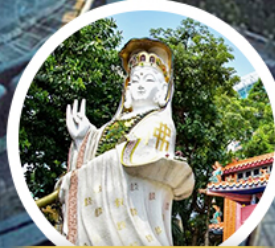
เจ้าแม่กวนอิม รัชลัส เบย์