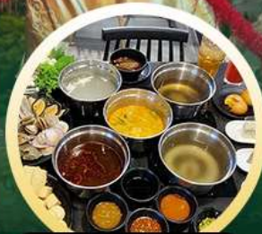
ซาบู่ฮ่องกง

02-04 มี.ย. 18-20 มี.ย. 07-09 มี.ย. 20-22 มี.ย. 13-15 มี.ย. 25-27 มี.ย. 14-16 มี.ย. 28-30 มี.ย.