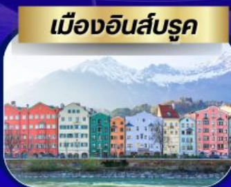
เมืองอินส์บรุค