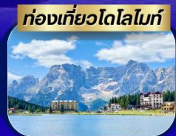
ท่องเที่ยวโดโลไมท์