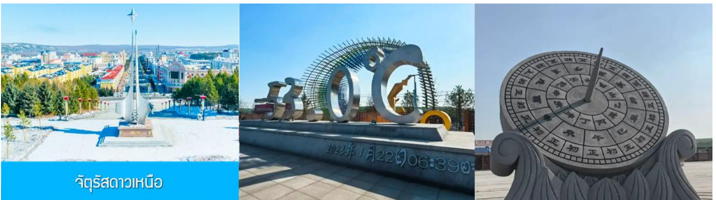
จัตุรัสดาวเหนือ