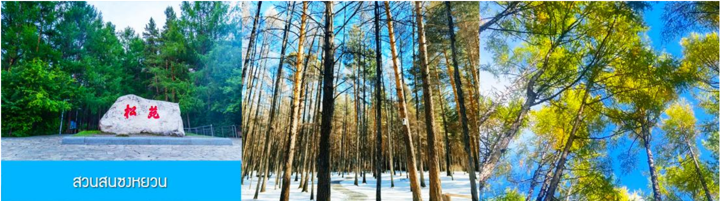
สวนสนขงหยวน

เช้า รับประทานอาหารเช้า ณ ห้องอาหารของโรงแรม (22)