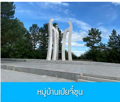
หมู่บ้านเป่ย์จื๋อ

เที่ยง รับประทานอาหารกลางวัน ณ ร้านอาหารระหว่างทาง (20)