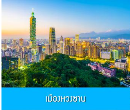
เมืองหวงซาน