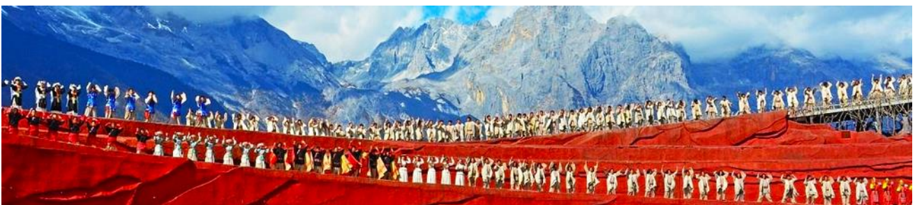
การแสดง IMPRESSION LIJIANG

ชม การแสดง IMPRESSION LIJIANG โชว์อันยิ่งใหญ่โดยผู้กำกับชื่อก้องโลก “จาง อี้โหมว” ได้เนรมิต ให้ภูเขาหิมะมังกรหยกเป็นฉากหลัง และบริเวณทุ่งหญ้าเป็นเวทีการแสดง โดยใช้นักแสดงกว่า 600 ชีวิต แสง สี เสียง การแต่งกายตระการตา เล่าเรื่องราวชีวิตความเป็นอยู่ และชาวเผ่าต่างๆของเมืองลี่เจียง