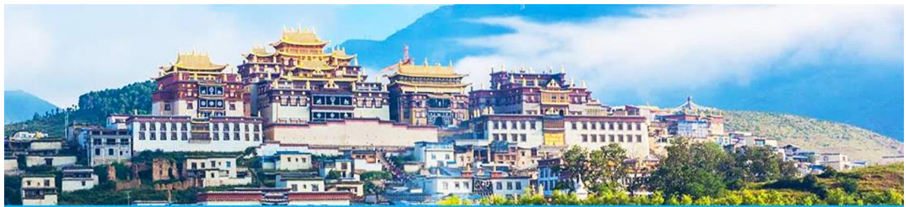
เมืองโบราณแซงกริล่า

เมื่อเสร็จจากการเที่ยวชมช่องแคบเสือกระโจน นำท่านเดินทางต่อสู่เมือง แซงกริล่า ซึ่งอยู่ทางทิศตะวันออกเฉียงเหนือของมณฑลยูนนาน ซึ่งมีพรมแดนติดกับอาณาเขตนำซี ของเมืองลี่เจียง และอาณาจักรหิ ของเมืองหนิงหลง สถานที่แห่งนี้จึงได้ชื่อว่า ดินแดนแห่งความฝัน ที่ตั้งอยู่บนที่ราบสูงทางทิศตะวันตกเฉียงใต้ของจีน