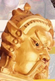
วัดแห่งองค์ปัจจุบัน