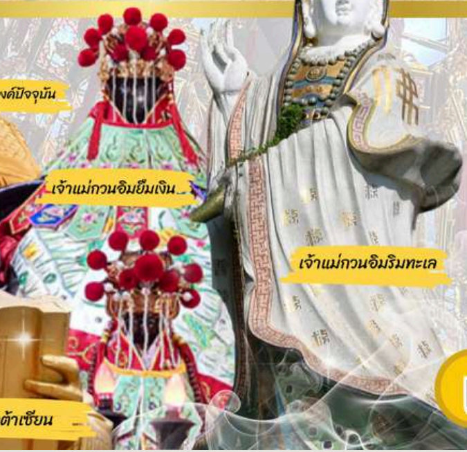
เจ้าแม่กวนอิมยืมเงิน