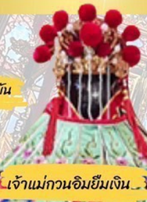
เจ้าแม่กวนอิมฮิมเงิน