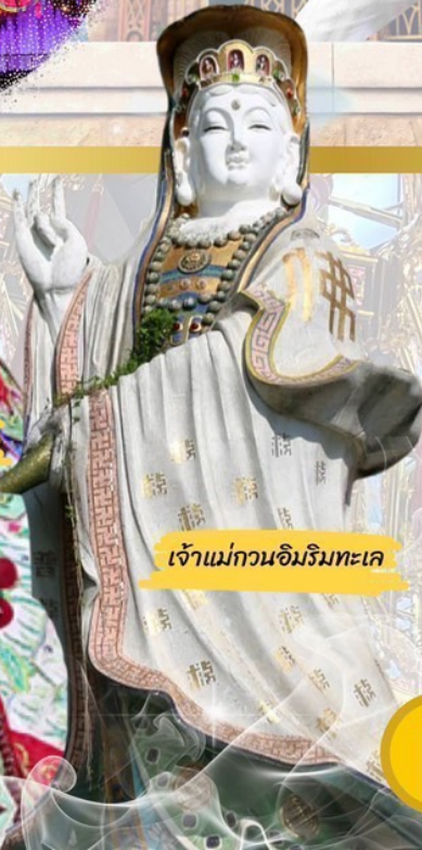
เจ้าแม่กวนอิมวิมทะเล