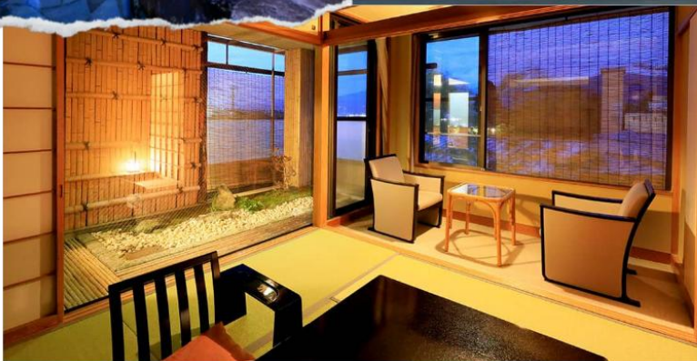
Japanese-style Room 17 sqm