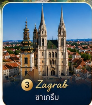
3 Zagreb ซาเกร็บ