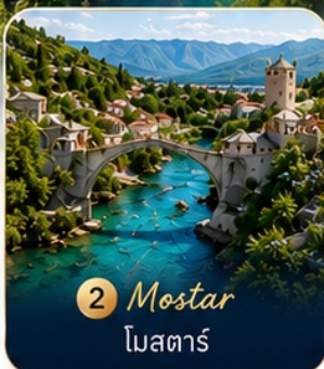
2 Mostar โมสตาร์