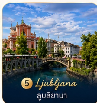
5 Ljubljana ลูบลียานา