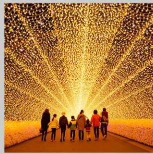
“NABANA NO SATO”