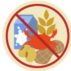
● แพ้อาหาร / อื่นๆโปรดระบุ