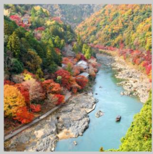
“ARASHIYAMA MT. KAMEYAMA”