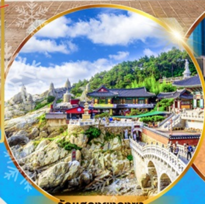
วัดแสงยงกุงซา