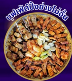
ซูฟเฟิลปังย่างไข่มุก