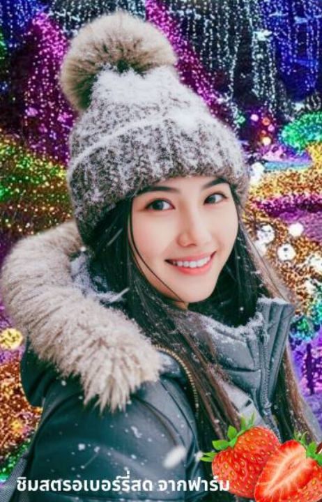
ชิมสตรอเบอร์รี่สด จากฟาร์ม