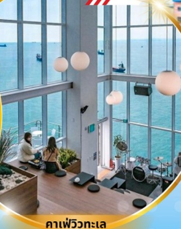
คาเฟ่วิวทะเล

ถ่ายรูปชิคๆ หมู่บ้านวัฒนธรรมคิมซอน ใหม่ล่าสุด คาเฟ่ริมทะเล วิวหลักล้าน ขึ้นเคเบิลคาร์ ชมทะเลปูซาน ห้ามพลาด!! ตลาดปลาที่ใหญ่ที่สุด ชิมของอร่อยที่ตลาดแฮนแด ช้อปปิ้งตลาดพื้นเมือง แหล่งช้อปปิ้งใต้ดิน ซัมยอน อิสระช้อปปิ้ง Lotte Duty Free