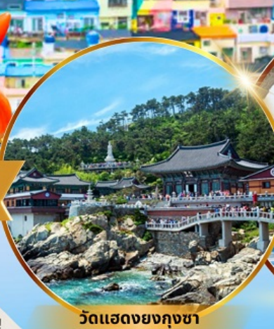
วัดแสดงยงกุงซา