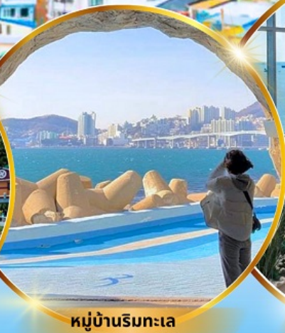
หมู่บ้านริมทะเล