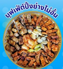
บุฟเฟ่ต์ปังอย่างไม่อื่น