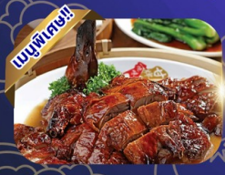
เปิดอย่างฮ่องกง