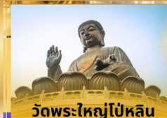
วัดพระใหญ่โป้หลิน