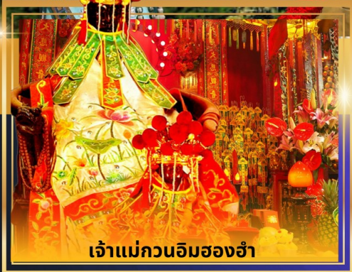
เจ้าแม่กวนอิมของอ่ำ