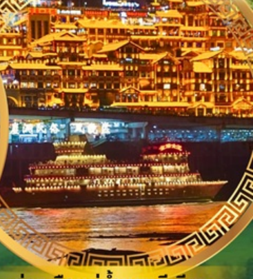
ล่องเรือแม่น้ำแยงซีเกียง

อุทยานแห่งชาติหลุมฟ้าสะพานสวรรค์ ระเบียงกระจก อุทยานเขานางฟ้า ใต้เจียงเซียง ห้างการ์เด็นกว้างหวน พระพุทธรูปแกะสลักหิน หมู่บ้านโบราณฉือชี่ไช่ ชมรถไฟฟ้าทะลุตึก ตึกหุยซิง ตึกตะเกียบ ถนนคนเดินเจียงฟ้างเป๋ย ล่องเรือแม่น้ำแยงซีเกียงวิวคำคิน อิสระช้อปปิ้งหงหยาดัง