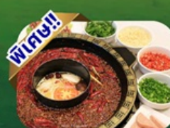
เมนูสุกี้หมาล่า

พักโรงแรม 4 ดาว ★★★★★ ฟรี ประกันอุบัติเหตุ บริการ อาหารท้องถิ่น