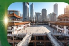
ตึกหุยซิง

อุทยานแห่งชาติหลุมฟ้าสะพานสวรรค์ ระเบียงกระจก อุทยานเขานางฟ้า ใต้เจียงเซียง ห้างการ์เด็นกว้างหวน พระพุทธรูปแกะสลักหิน หมู่บ้านโบราณฉือชี่ไช่ ชมรถไฟฟ้าทะลุตึก ตึกหุยซิง ตึกตะเกียบ ถนนคนเดินเจียงฟ้างเป๋ย ล่องเรือแม่น้ำแยงซีเกียงวิวคำคิน อิสระช้อปปิ้งหงหยาดัง