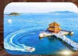
สะพานฉานเจียว