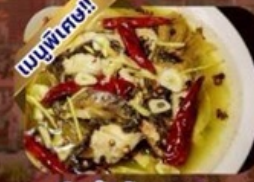
ปลาต้มพริกทอด