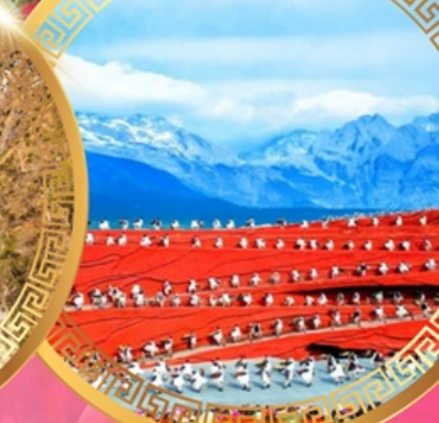
ความประทับใจแห่งลี่เจียง