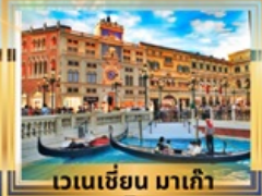
เวเนเซียน มาเก๊า