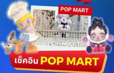
เช็คอิน POP MART