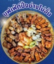
บุฟเฟ่ต์ปิ้งย่างไม่วัน