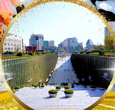
มหาลัยหญิงอีวา