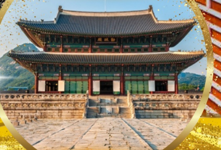
พระราชวังเคียงบกกุง

EASTAR JET / t'way 이스타항공 เดินทาง ต.ค. - พ.ย. 67 น้ำหนัก 20 Kg. Carry on 10 Kg.