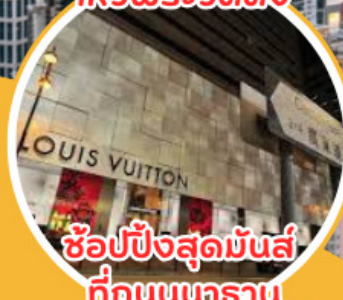
ช้อปปิ้งสุดมันส์ ที่ถนนนทราณ