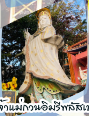
เจ้าแม่กวนอิมรัพลัสเบง