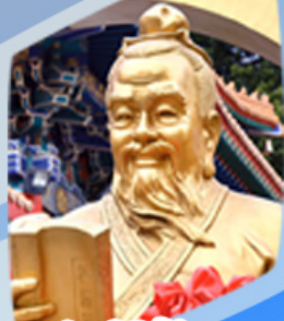
หลวงดำเซ็งน