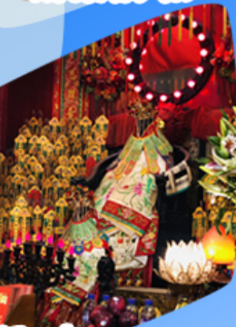
เจ้าแม่กวนอิมขี้มเงิน