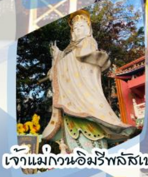
เจ้าแม่กวนอิมรีพลัสเบย์