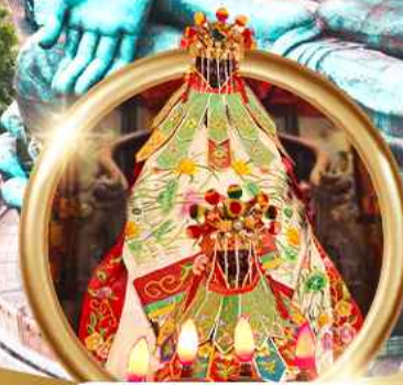
ขีมนเงินเจ้าแม่กวนอิมสองฮา