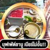
บุฟเฟ่ต์ชาบู เบียร์ไม่อั้น!!