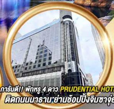
การ์ตูนดี! พักรู 4 ดาว PRUDENTIAL HOTEL ติดถนนนาราน: ย่านช้อปปิ้งจิมซาจอย