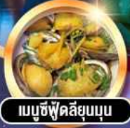
เมนูซีฟู้ดลิ้นจี่