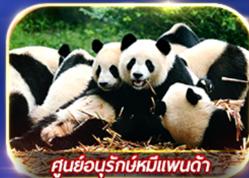
ศูนย์อนุรักษ์หมีแพนด้า