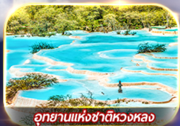
อุทยานแห่งชาติหวงหลง