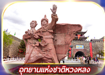
อุทยานแห่งชาติหวงหลง