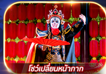
โชว์เปลี่ยนหน้ากาก

สัมผัสความงาม 2 อุทยานแห่งชาติ จิวจ้ายโกวและหวงหลง เมืองโบราณซงพาน ศูนย์อนุรักษ์หมีแพนด้า ชมโชว์เปลี่ยนหน้ากาก