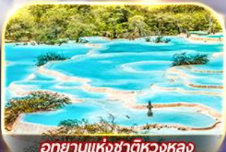
อุทยานแห่งชาติหวงหลง