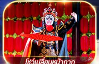
โชว์เปลี่ยนหน้ากาก

สัมผัสความงาม 2 อุทยานแห่งชาติ จิวเจียโกวและหวงหลง เมืองโบราณซงพาน ศูนย์อนุรักษ์หมีแพนด้า ชมโชว์เปลี่ยนหน้ากาก