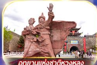
อุทยานแห่งชาติหวงหลง