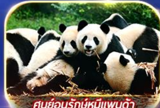
ศูนย์อนุรักษ์หมีแพนด้า