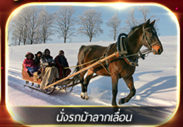
นั่งรถม้าลากเลื่อน

ฟรีนั่งรถม้าลากเลื่อน ชมโชว์ว่ายน้ำน้ำแข็ง แม่น้ำชงหวาเจียง