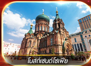
โบสถ์เซนต์โซเฟีย