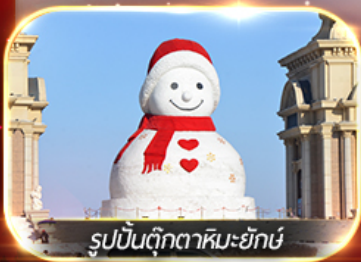
รูปปั้นตุ๊กตาหิมะยักษ์