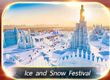
Ice and Snow Festival