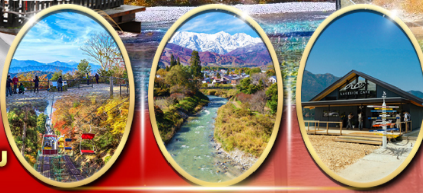
ภูเขา ทาคาโอะ ไอโอเดะพาร์ค Ao Lakeside Cafe