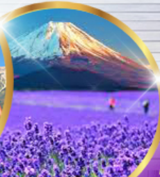
โออิชิ ปาร์ค