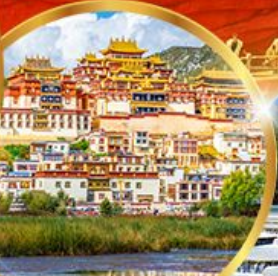
วัดชงจันหลิน