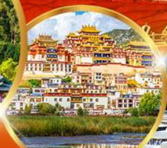
วัดชงจ้านหลิน