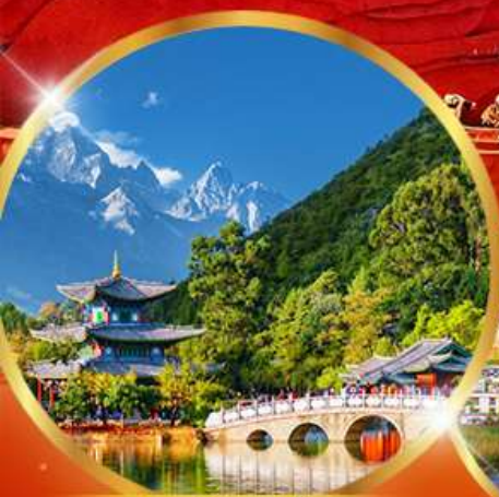
สระมิงกรดำ