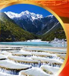
หุบเขาพระจันทร์ สีน้ำเงิน