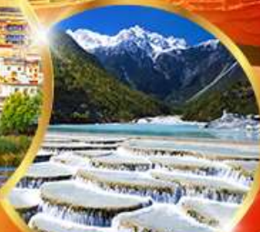
หุบเขาพระจันทร์ สีน้ำเงิน