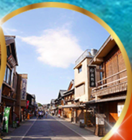
ถนนคนเดินอิเสะ