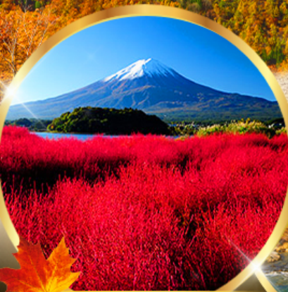
ไอชิ พาร์ค