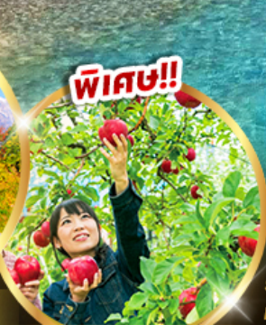
บฟพีต้าแอปเปิ้ล