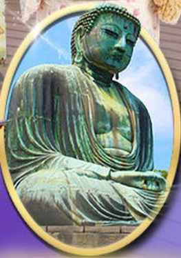
พระใหญ่คามาคุระ