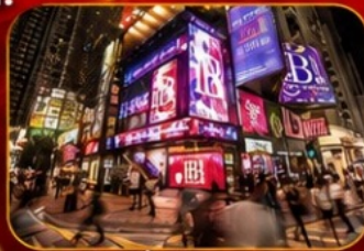
ซอปปิงซิมซาฮุย