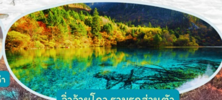
จิวจ้ายโกว รวมรถส่วนตัว