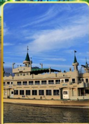
ล่องเรือทะเลสาบโทยะ