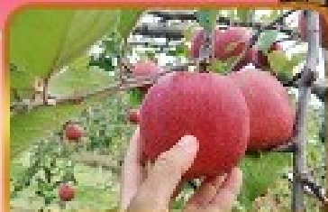
เก็บแอมเบิ้ล