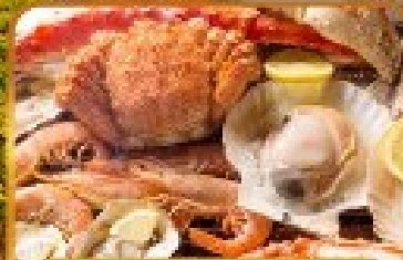
บิงย่างร้านดังเนินตะ